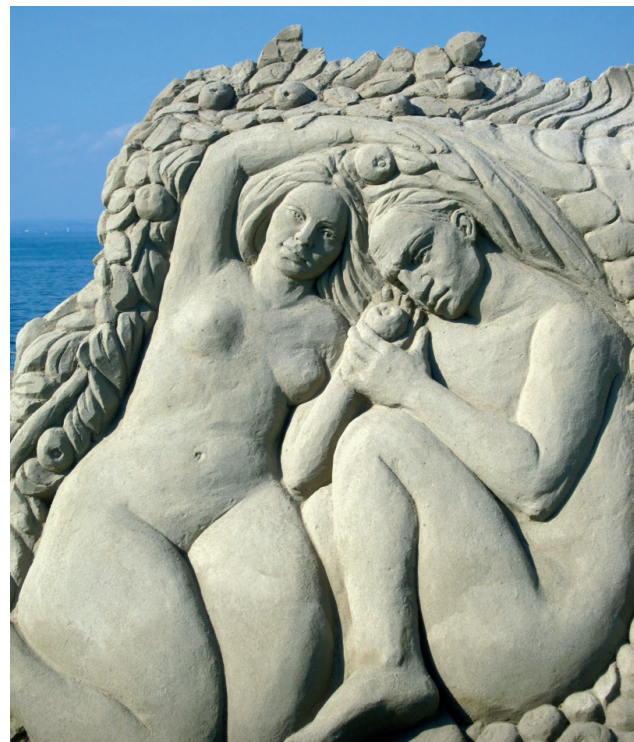
Sandskulpturen (siehe auch Seite 7), zu bewundern am 11. Internationalen Sandskulpturenfestival in Rorschach im August und September 2009.