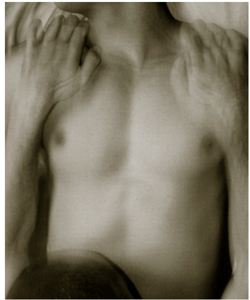
Illustration aus «Love Bugs»

Sehr schön gestaltet und umfangreich ist dieses 130 Seiten starke Buch über Frausein, Liebe, Sexualität und Gestaltung. Ziel des Buches ist «wenig Frust, viel Lust und starke Erlebnisse»; übersichtlich gestaltet und informativ. Alle erwähnten Broschüren sind erhältlich bei der AHSGA, St. Gallen, Telefon 071 223 68 08 oder über ahsga@hivnet.ch