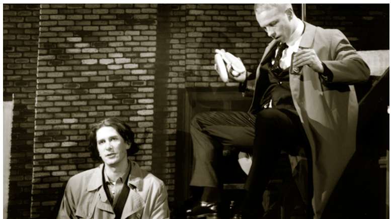
Szenenfoto aus «Angels in America», Teil 1, Theater St. Gallen, Studiobühne, 2004

wortung ohne Zwang, also von einer Kampagne, die auf Lernbereitschaft aufbaut und die Solidarität mit den Menschen mit HIV und AIDS in den Mittelpunkt stellt, muss immer wieder neu erkämpft werden. Auch wir von der AGSGA wurden noch Mitte der Neunzigerjahre bei Auseinandersetzungen rund um das Lehrmittel «Sexualerziehung und AIDS» als «Saukerle» bezeichnet, welche die Jugend zum Sex verführten. Deshalb lohnt es sich, wachsam zu bleiben. Hierbei können die Botschaften von Tony Kushners «Angels in America» zu AIDS, Homosexualität und den Dramen menschlicher Beziehungen helfen. Das Stück ist eine tiefgründige Auseinandersetzung mit AIDS und Homosexualität, gleichzeitig aber auch eine Auseinandersetzung mit grundlegenden Fragen nach Leben und Tod.