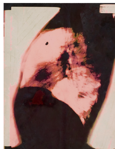
Mark Morrisroe: Untitled , 1988, Colorized gelatine silver print, photograph of X-ray, 43,3 x 35,5 cm

Neben HIV/Aids gibt es andere Geschlechtskrankheiten. Diese nehmen zur Zeit stark zu, besonders bei schwulen Männern. Die Aids-Hilfe Schweiz will mit der neuen Kampagne The Easy Rider darauf hinweisen und zeigt, wie MANN sich neben HIV auch vor anderen Geschlechtskrankheiten schützen kann. Zur neuen Kampagne wurde ein cooler Videoclip produziert, welcher den Easy Rider mit vollem Körpereinsatz zeigt. Alle Informationen sind auf www.gay-box.ch zu finden. R.B.