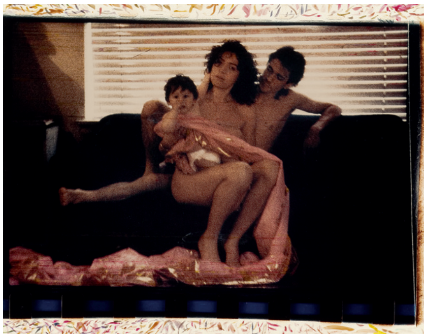
Mark Morrisroe: Untitled , ca. 1984. C-print, negative sandwich, retouched with ink, 40,6 x 50,8 cm.