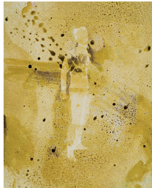
Mark Morrisroe: Untitled , 1987. Toned gelatin silver print, photograph of printed material 35,6 x 27,9 cm.

Interessant mit Blick auf die Prostitution ist dies: Das Verhältnis bei den jüngsten Frauen und Männern auf dieser Seitensprung-Website ist 1:1. Frauen können nicht wie Männer zu Prostituierten gehen. Die meisten wollen auch nicht. Wenn schon, dann eher in einen Club. Was überhaupt nicht heisst, dass sie nur romantischen Sex wollen, den hätten sie ja zuhause. Sie wollen mehr geboten bekommen. Da müssen sich die Männer etwas einfallen lassen. Müssen vor allem Männer sein. Bringen sie das nicht, sind sie chancenlos. Frauen, die auf der Suche sind, wissen sehr genau, was sie wollen. Gemütlichkeit haben sie zu Hause genug. Sie wollen Leidenschaft, Drama. Überwältigt sein. Blümchen pflücken können sie auch allein. Das kann Prostitution