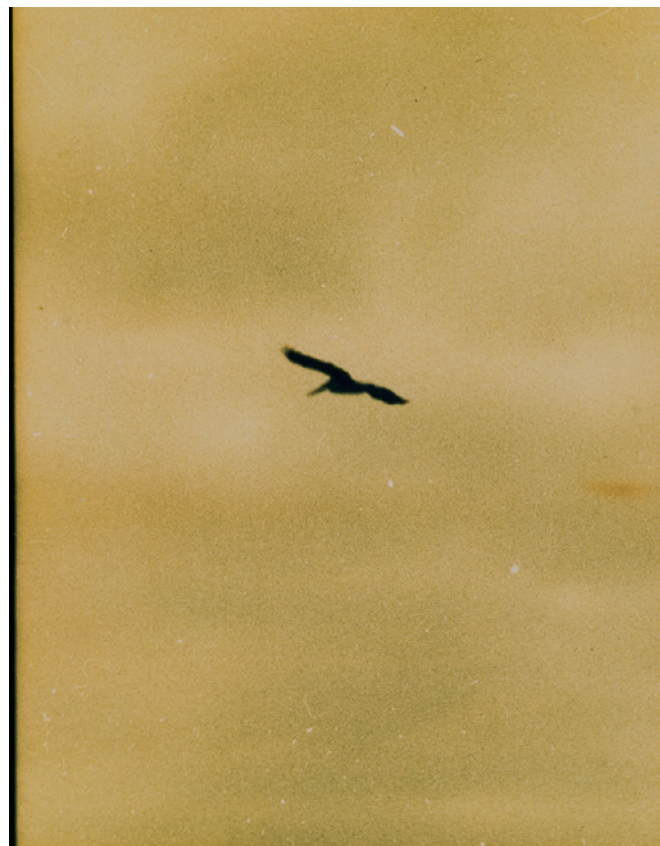
Mark Morrisroe (s. Seite 2): Untitled, ca. 1987. C-print, negative sandwich 50,8 x 40,6 cm.

Es gab andere Kulturen. Zum Beispiel das alte hinduistische Indien – mit Shiva, der eigentlich der Gott der Zerstörung ist, aber auch der sexuelle Superman der Lustgöttin Shakti, und in dieser lustvollen Verbindung schafft er das Universum ständig neu; womit das Zerstörerische und das Schöpferische der Sexualität vermählt war. Das erlaubte, Prostitution nicht nur zu dulden, sondern in den Tempel des Göttlichen aufzunehmen. Und damit Sexualität mit dem Sakralen zu verbinden. Tempel-Prostituierte waren über Jahrhunderte die gebildeten Frauen, sie durchliefen Jahre der Ausbildung. Kamasutra. Sexarbeiterinnen? Priesterinnen der gewaltigsten Lebensenergie, der Sexualität ... 1947 verboten. Heute ist Indien ein prüdes Land. Nicht so prüde wie die bürgerliche Gesell-