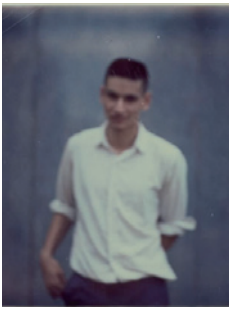
(Selbstporträt, Sammlung Ringier)