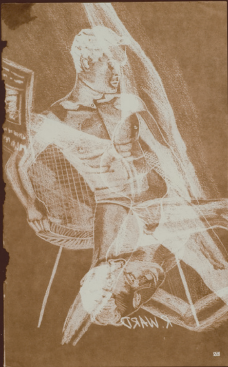
Mark Morrisroe: Drawing, 1986. Tone gelatin silver print, photogram of printed material, 25,2 x 20,3 cm.

Leider empfiehlt das neue BAG-Programm eine – auch organisatorische – Aufteilung der hauptsächlichen Präventionsgruppen in Allgemeinbevölkerung/ Jugend und vulnerable Gruppierungen. Verschiedene Dachverbände sollen in Zukunft dafür zuständig sein: PLANE im ersten Bereich und AHS für die vulnerablen Gruppierungen. Dies, so These sie-