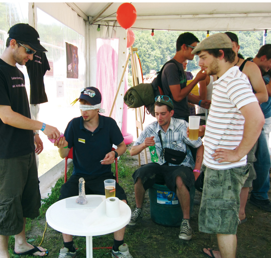
Jugendliche beim Parcours: Blind ein Kondom über einen Plastik-Penis ziehen.

Die sexuelle Aufklärung der Jugendlichen ist das «A und O» der HIV- und Aids-Prävention. Die Fachstelle/Aidshilfe St. Gallen-Appenzell engagierte sich daher auch in diesem Jahr am St. Galler Open Air-Festival mit einem Info-Stand.