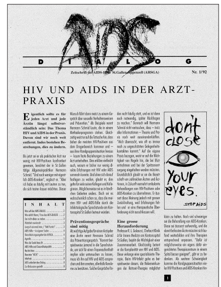
1991 – auf grauem Papier und etwas düster: 1991 – die erste Ausgabe des AIDS-Dialogs.

Gerne stellen wir Ihnen den DIALOG auch in der neuen elektronischen Form per Mail zu. Wenn Sie dies wünschen und Sie uns Ihre Mailadresse noch nicht zugestellt haben, bitten wir um deren Zusendung an: info@ahsga.ch mit dem Vermerk: «DIALOG-Adresse». Wir freuen uns, wenn wir Sie auch weiterhin zu unseren LeserInnen zählen dürfen. Fachstelle/AHSGA und Redaktion