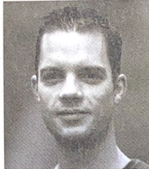
Übergabe des Projekts MSM

Neben der üblichen Informations-, Präventions- und Öffentlichkeitsarbeit startete ich dieses Jahr beispielsweise das Projekt «STD's» (Sexually Transmitted Diseases). Resultat war eine kleine, kreditkartengrosse Faltbroschüre, in der die elf häufigsten sexuell übertragbaren Krankheiten aufgeführt werden. Dabei wird bei jeder Krankheit auf Symptome, Behandlung und Prävention eingegangen. Nach fünf lehrreichen und spannenden Jahren bedanke ich mich bei allen für die gute Zusammenarbeit.