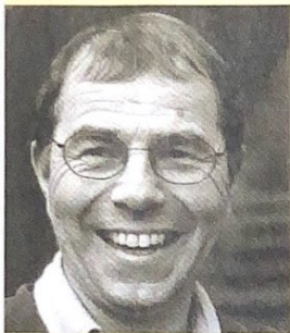
Schwanger und HIV-positiv

Sie hörte in ihrer Jugend immer wieder den Satz: «Aus dir wird mal nichts! Dich kann man zu nichts gebrauchen!» Es gab Zeiten, da begann sie diesen lieblosen Worten zu glauben und liess sich gehen. Sie kannte aber auch Zeiten, in denen sie sich stark und als Frau begehrt fühlte. Das tat gut, brachte aber auch Schwierigkeiten mit sich. Wie umgehen mit den Männern, den berauschten Augenblicken des Verliebtseins, den Träumen vom Glück? Das Erwachen war brutal. Sie wurde schwanger, HIV-positiv und von den Männern verlassen. Heute lebt sie mit ihren zwei schulpflichtigen Kindern in der Ostschweiz und gibt ihr Bestes, dass diese den Weg ins Leben finden. Gegen achtzigmal war ich für Präventionsveranstaltungen in den Kantonen St.Gallen, Appenzell Innerrhoden und Auserrhoden unterwegs. Am meisten gefragt war bei Eltern die Sexualerziehung als vorbeugende Massnahme gegen unerwünschte Schwangerschaft und sexuell übertragbare Krankheiten, an zweiter Stelle folgten die Einsätze an Berufs- und Kantonsschulen. Auf reges Interesse stiessen einmal mehr die Referate für Angehörige des Zivilschutzes, der freiwilligen Feuerwehr und der St.Galler Rekrutenschulen.