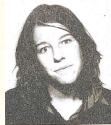
Open Airs 2002 ohne Stop-AIDS-Bus

Als mich die AHSGA vor einiger Zeit anfragte, ob ich Lust hätte, einen kleinen Bericht über das vergangene Jahr zu schreiben, war ich ziemlich vor den Kopf gestossen. Schmerzlich wurde mir erneut bewusst, was das Jahr 2001 alles verändert hatte.