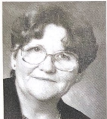
Börsenschwankungen, für uns fast kein Problem

«Meta, bis zum Freitag musst du noch den Text für den Jahresbericht abliefern», tönt es aus dem Büro des Chefs. Ja wirklich, schon ist wieder ein Jahr vorbei. Die Unsicherheit an der Börse und das Swissair-Grounding haben wir mitverfolgt und mit Zufriedenheit festgestellt, dass es eine gute Entscheidung war, das aus dem Legat stammende Aktien-Paket, welches auch Aktien der Saigroup enthielt, bereits im Oktober 2000 zu verkaufen. Das in einem konservativen Fonds reinvestierte Kapital hatte per 31. Dezember 2001 nur einen kleinen Kursrückgang zu verzeichnen. Sonst hatte ich in der Buchhaltung ein eher ruhiges Jahr, im Vergleich zu meinen Kolleginnen und Kollegen, die mir während ihrer Arbeit an der CD-Rom manchmal etwas nervös und hektisch erschienen. Meine Mitarbeit beim Projekt Act-hiv-itäten Plus hat mir im vergangenen Jahr viel Freude bereitet. Mit den verschiedenen Veranstaltungen versuchen wir, jedem Mitglied etwas zu bieten. Vor allem aber ist der Gedankenaustausch unter Betroffenen mit gleichen oder ähnlichen Problemen sehr wertvoll. Da sind die Zusammenkünfte von Act-hiv-itäten Plus sehr willkommen.