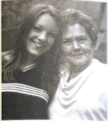
Mit einem lachenden und einem weinenden Auge

Das Jahr 2001 verging wie im Flug. Viele neue Herausforderungen kamen auf das Sekretariat zu. So die organisatorischen Vorbereitungen für unsere thematische Öffnung im Sinne des neuen Leitbilds. Daneben wurde ich auch vermehrt in die Arbeit an der CD-Rom miteinbezogen. Dabei habe ich viel Neues und Interessantes gelernt, auch für mich persönlich. Traurig war hingegen der Entscheid zur Aufgabe unseres Bus-Projekts. Die Suche nach freiwilligen HelferInnen wurde immer schwieriger. Schade!